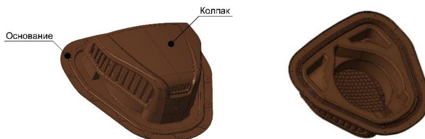
Внешний вид и основные детали

Аэратор точечный Döcke PIE NEXT (далее – «изделие») служит для организации проветривания подкровельного пространства крыш, у которых в качестве кровельного покрытия используется гибкая битумная черепица или фальцевая кровля. Для корректной работы необходимо предварительно организовать приток воздуха через карнизный свес, а также канал, по которому воздух будет поступать к изделию. Устанавливается на смонтированную кровлю. Цвет изделия – зелёный (аналог RR11), светло-коричневый (аналог RAL8017), красный (аналог RR29), серый (аналог RR23), тёмно-коричневый (аналог RR32). Состоит из основания (проходного элемента), колпака, бутилового уплотнителя, шаблона и комплекта саморезов под цвет изделия.